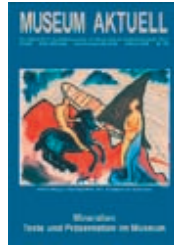
2 x Titelseiten (Firma, Museum)